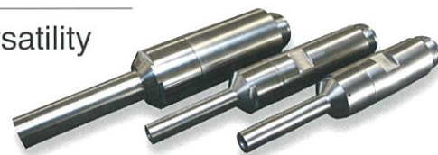
断面モデル A Section Model

Basic model of the hot runner resulting from pursuit of versatility that can take effect in every situation.